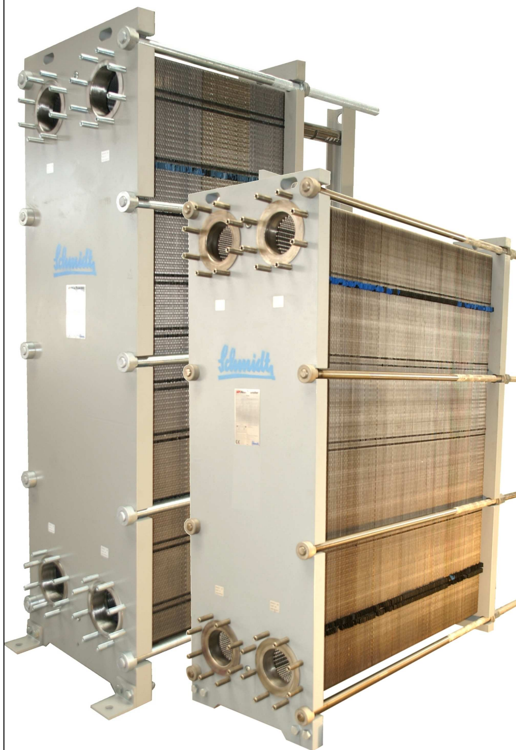
SIGMA 76 / 96 SCAMBIATORE DI CALORE A PISTRE